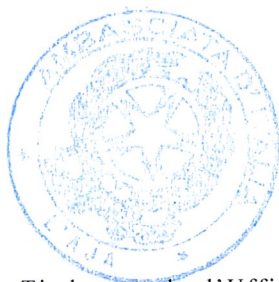
Timbro tondo d'Ufficio