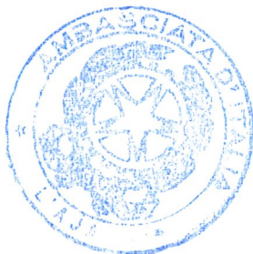
Timbro tondo d'Ufficio

IL PRESENTE AVVISO È STATO AFFISSO ALL'ALBO DI QUESTA AMBASCIATA D'ITALIA A L'AJA IL GIORNO 19 febbraio 2025